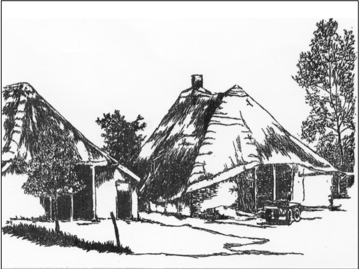
Bossheweg 42 vanaf de straatzijde ( boerderij rechts).

zijn het er wel eens meer geweest dan het aantal van 13 in 1815. Bij de volkstelling in 1811 wordt een aantal genoemd van 29 gereformeerden en 3 lutheranen. 6)