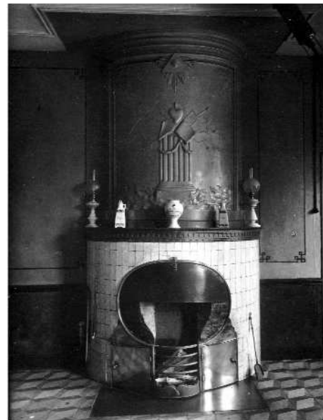
Foto van de schouw met open haard in het landhuis van voormalig burgemeester Gerardus Godschalk en Joanna van den Westelaken nabij de kerk aan de Litsersstraat omstreeks 1921.

en werd water verhit. Het water werd door middel van een ketel aan een 'haal' boven het vuur heet gestookt. Op het eind van de 19e eeuw kwam de kachel in zwang. Een tussenform van het haardvuur en de kachel was de kachelhaard, een gietijzeren kast met een open voorkant, waarbij het verbrandingsproces met een grote klep boven de vuurhaard geregeld kon worden. Dergelijke inrichtingen waren er in de 19e eeuw maar bij enkele welgestelden in gebruik. De meest gebruikte brandstof was hout of turf, houtspaanders en dergelijke, hoewel er in een enkel geval ook