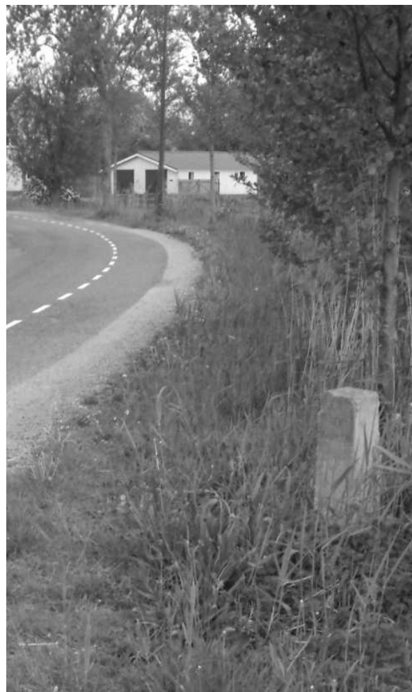
Grenspaal in de Spurkstraat waar deze momenteel ten onrechte staat.

De intentie van dit artikel is mede om de grenspaal opnieuw te laten uitgraven en in overleg met Rijkswaterstaat en de gemeente Sint-Michielsgestel een plaats te geven zoals hiervoor reeds is vermeld en historisch verantwoord is: namelijk zo kort mogelijk bij de oorspronkelijke plek waar de voormalige gemeentegrens tussen Den Dungen en Berlicum lag.