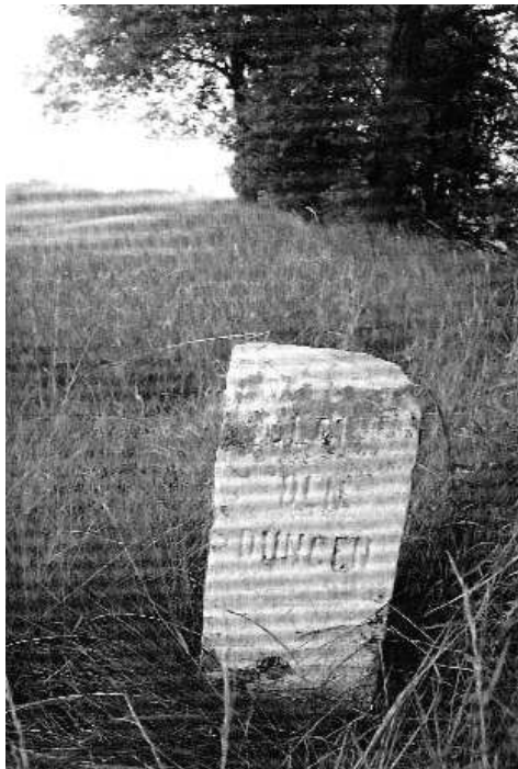
De grenspaal op de oorspronkelijke plaats langs het kanaal herinnert ons aan de voormalige grens tussen Den Dungen en Berlicum.

Ervoor in de plaats werd een nieuwe grote sluis ter hoogte van Schijndel gebouwd. Het Maximakanaal buigt nabij de Nijvelaar in Den Dungen af richting de Maas bij Empel en ligt ten oosten van 's-Hertogenbosch. Nadat de verbreding van het kanaal vanaf Middelrode was voltooid en het Maximakanaal in 2014 was gegraven kunnen grote schepen via deze vaarweg van en naar Veghel varen en hoeven niet meer via de Zuid-Willemsvaart door de binnenstad van 's-Hertogenbosch.