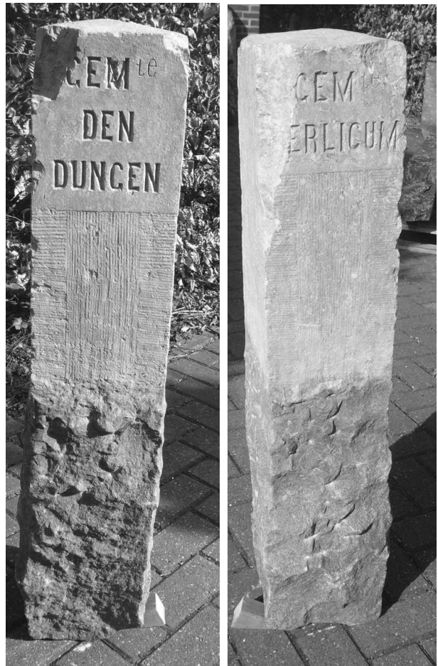
Grenspaal met aan de ene kant gemeente Den Dungen en aan de andere kant gemeente Berlicum.

ven van het Maximakanaal werd het kanaal vanaf Veghel tot Middelrode al verbreed om het bevaarbaar te maken voor schepen tot circa 1000 ton. Sluis 2 bij Middelrode en sluis 3 bij Dinther kwamen daarbij te vervallen.