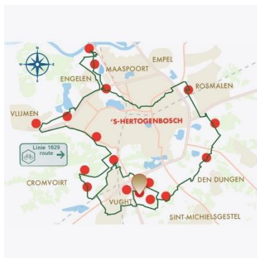
Kaart linie 1629

Dit is de aanvalslinie van stadhouder Frederik Hendrik, tevens prins van Oranje. Deze legde een meer dan veertig kilometer lange aanvalslinie aan; later bekend als Linie 1629. Een aaneenschakeling van dijken en grachten, die werden beschermd met uitkijkposten, schansen en redoutes. Den Dungen bevond zich in 1629 op een deel van die linie van Frederik Hendrik. Den Dungen hoorde toen nog bij 's-Hertogenbosch en de mensen waren meestal katholiek. Zij waren dus niet blij met de belegering en soldaten van de Oranjegezinden, die helemaal rondom de stad Den Bosch gelegd waren om de stad te veroveren. Met een groots opgezette aanval werd de stad onder leiding van Frederik Hendrik ingenomen waardoor de Oranjegezinden de baas werden. Een moeilijke tijd voor de katholieke Bosschenaren en Dungenaren. De strijd staat bekend als het beleg van Den Bosch, ook wel de val van Den Bosch.